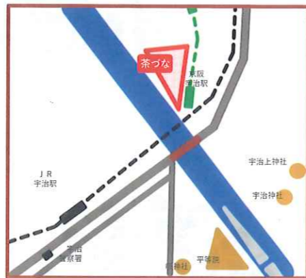
茶づな周辺図 *京阪宇治駅下車 西へ徒歩4分

申込 申込書(右ページ)に記入のうえ、 郵送またはファックスで下記へお送りください。 ※電話申込もできます。受付時に申込書に記載の内容をお聞きします。 ※要介護者等が市外在住の場合、介護保険被保険者証の写しを ご提出ください。