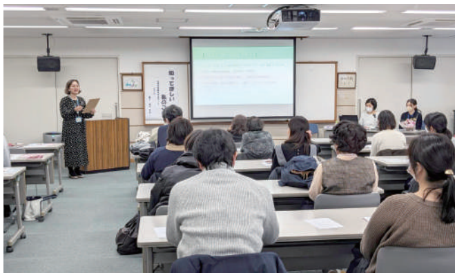
宇治で開催したセミナー。約50人の参加を得ました。

“side by side”は「寄り添う」という意味で、名付け親は娘。それをもじって「才才の会」という会の名前にしました。「才」の字には、どんな子にも「才能」があって、それを引き出してあげたいという思いが込められています。