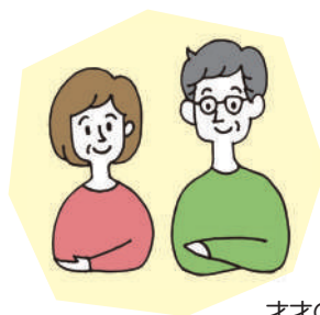
才才の会イメージ

親には親の人生、子には子の人生があります。「才才の会」は、主に、子どもの「自立」が見えてくる青年期以降(15歳～)の子の家族会です。中学まではあった学校教育のなかでのサポートを受ける機会が減り、進学、就労、親離れなどの難題に直面する時期。小さいときは手をかけることがよしとされても、青年期以降はある程度の「距離感」を保つことも大事になってきます。