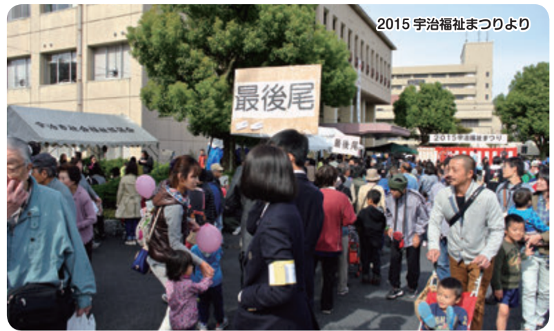
2015 宇治福祉まつりより

身近な福祉活動やボランティア活動団体等による、ステージ発表や模擬店など。楽しく交流しながら「ふくし」のことを知っていただける場として開催します。