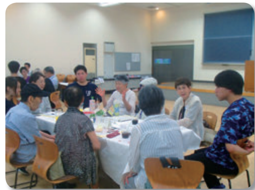
交流会でのひとコマ

参加申込書は、宇治市総合福祉会館もしくは、宇治市健康生きがい課にあります。 郵送・ファックスで宇治市社会福祉協議会へお申し込みいただくか、電話の場合は、参加者名(介護者名)・住所・電話番号・介護を要する人との続柄、介護を要する人の氏名・要介護度・生年月日・年齢をお伝えください。 *交流会は、介護を要する方との同伴の有無をお伝えください。 *お申し込みの後、参加要件を確認後、ご案内をさせていただきます。 *ファックスでの申し込みの際は、着信確認をお願いいたします。