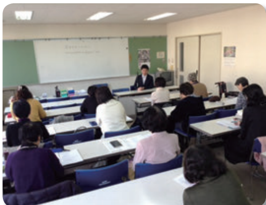
共同募金配分事業”音訳ボランティア養成講座”