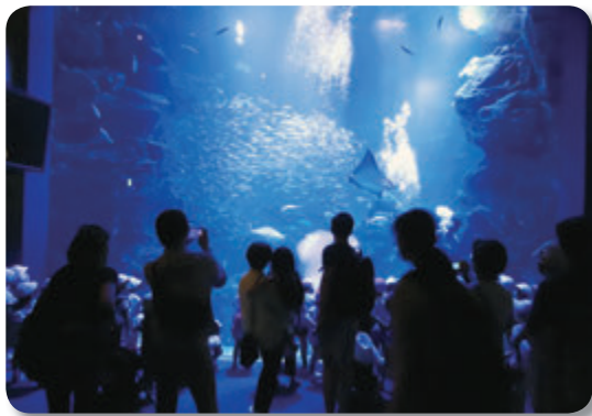
京都水族館(※第1回目の様子)