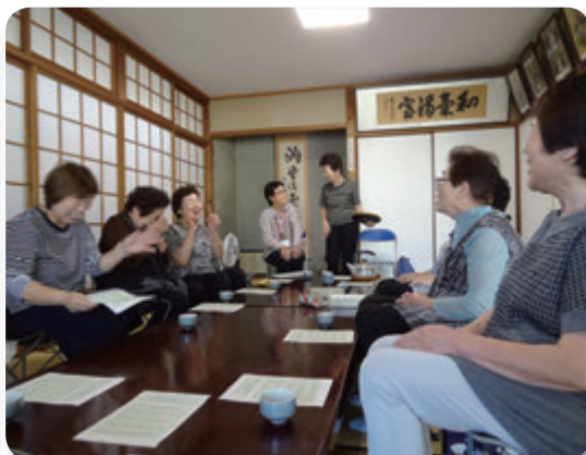
共同募金配分事業”Hot! ふれあいサロン”