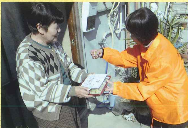
〈ボランティアによる高齢者への配食サービスの様子〉

商売と暮らして密接にかかわっているもの。 それと同じように 福祉と暮らしも密接にかかわっています。